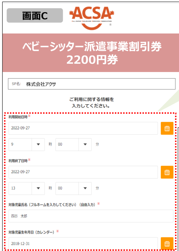
利用情報登録画面